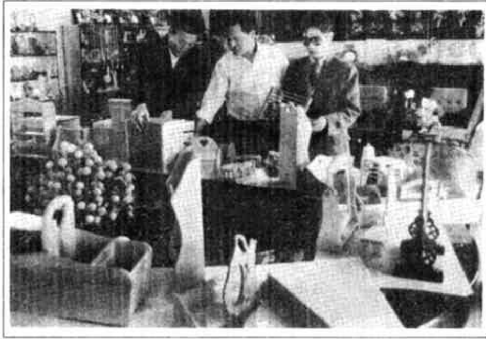
垦利县郝家乡大漆家具厂继大漆家具系列产品之后，又开发出居室小用俱系列工艺产品。产品投放市场后，倍受外商青睐。